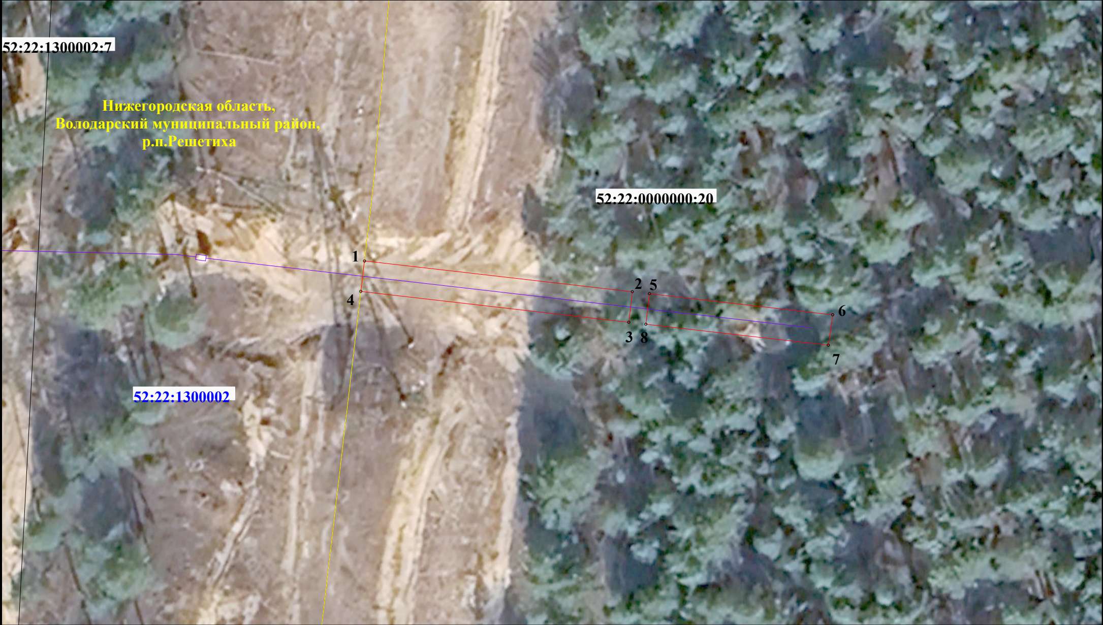
Схема границ публичного сервитута на кадастровом плане территории Местоположение: Нижегородская область, Володарский муниципальный район Кадастровые номера земельных участков, в отношении которых предполагается установление публичного сервитута: 52:22:0000000:20 Публичный сервитут. Цель установления публичного сервитута: Строительство и эксплуатация объекта газоснабжения «Сеть газораспределения высокого давления 1 категории и низкого давления к жилым домам по улице 70-летия Победы, п. Решетиха, Володарский район, Нижегородская область (№ 52-21-102-003860)». Срок публичного сервитута - 10 лет